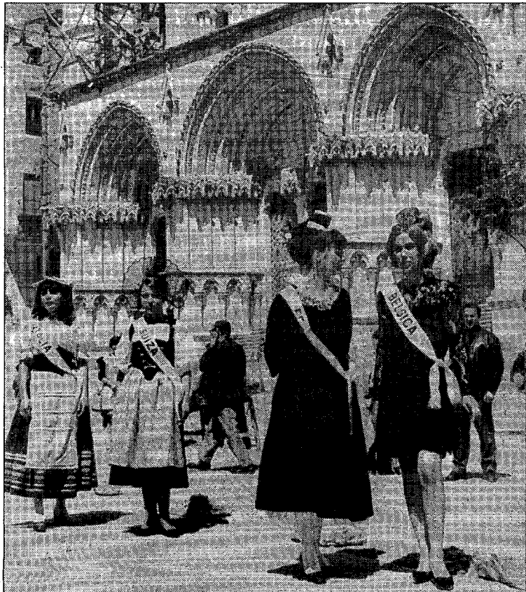
La belleza de la Catedral, rodeada de guapas internacionales.

ÁLBUM DEL RECUERDO. Las imágenes que recibamos en la redacción deberán ir acompañadas de unas breves líneas en las que se