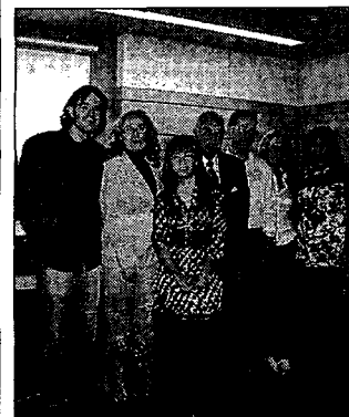
Entrega de premios.