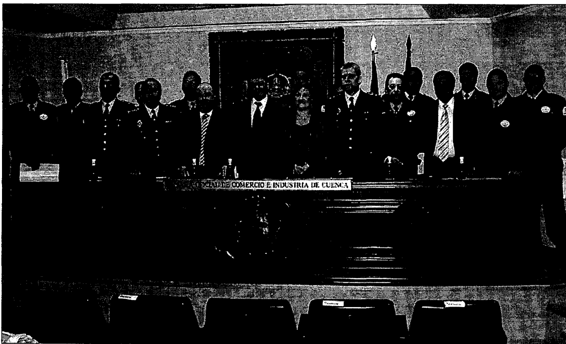
El delegado de Gobierno y el presidente de la Cámara, con los galardonados.