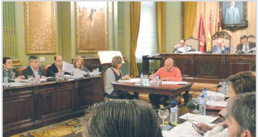
Pleno de la Diputación Provincial de Albacete.

"Al igual que los municipios pequeños no verán mermado el apoyo de la Diputación, también se realizará un esfuerzo para seguir colaborando con las asociaciones socio-sanitarias", aseguró el presidente, que también explicó que, en el capítulo de Personal, "los acuerdos alcanzados con los sindica-