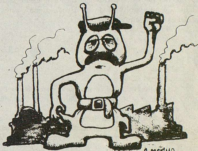
EL BICHO ROJO

Esta manzana la tirará el Bicho Rojo, la otra, la tenemos que tirar entre todos.