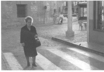
Sobre estas líneas, dos escenas actuales en La Mancha: un pastor, acarreado al rebaño; y una viejecita, caminando una calle de La Solana.

Muchos son los pueblos de La Mancha que quieren ser ese “lugar de cuyo nombre no quiero acordarme”. En Argamasilla aseguran que Cervantes estuvo preso en la cueva de Medrano y que en ese sitio inició la escritura de El Quijote . Nada lo prueba, nada lo desdice: es cuestión de creencias.