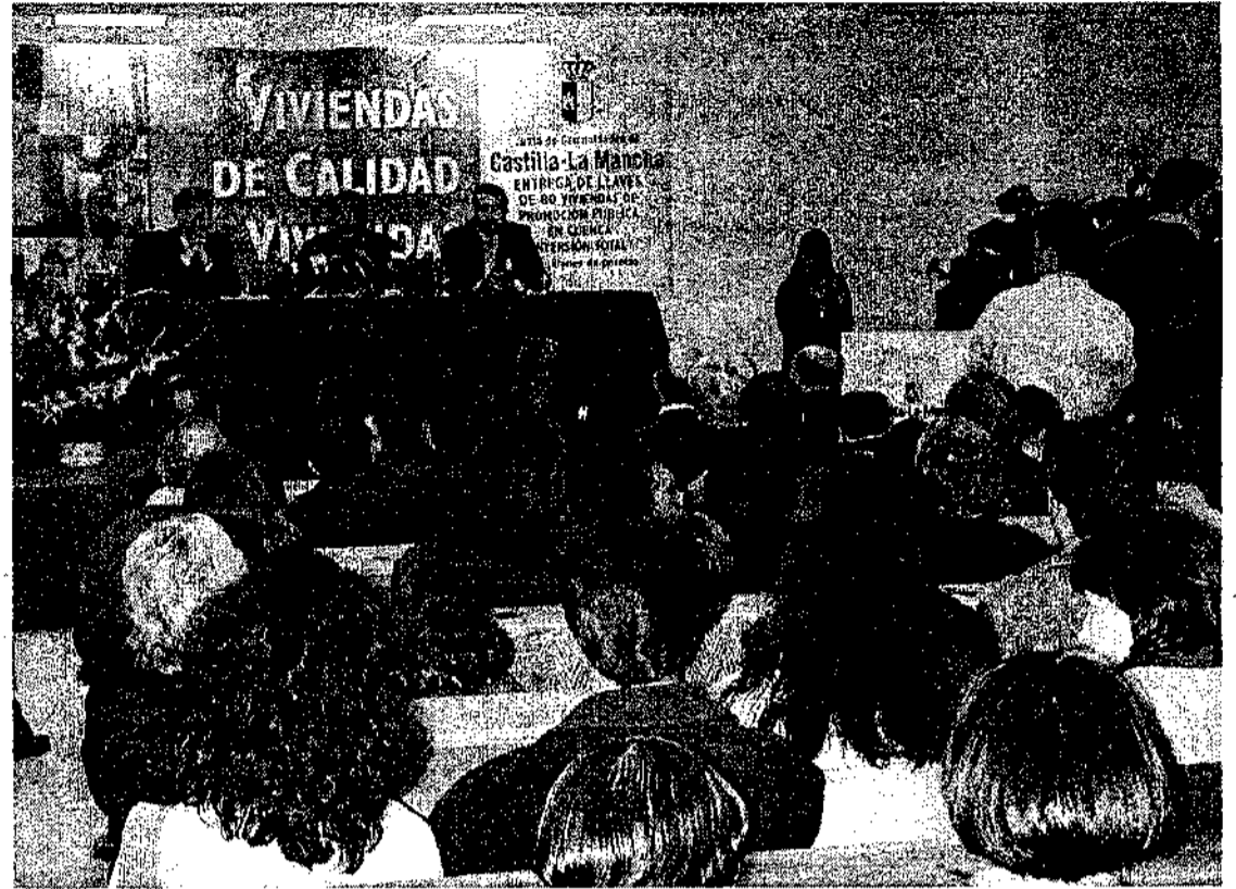
Imagen del acto de entrega de llaves a los beneficiarios de las viviendas. Los salones parroquiales de la iglesia de San Fernando estuvieron repletos de gente.

Por otro lado, y también a preguntas de los periodistas, el presidente Bono puso de nuevo de manifiesto su compromiso de