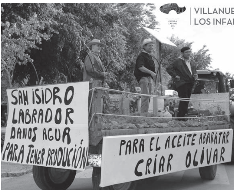
Carrozas, segundo clasificado "Para el aceite abaratar, criar olivar"