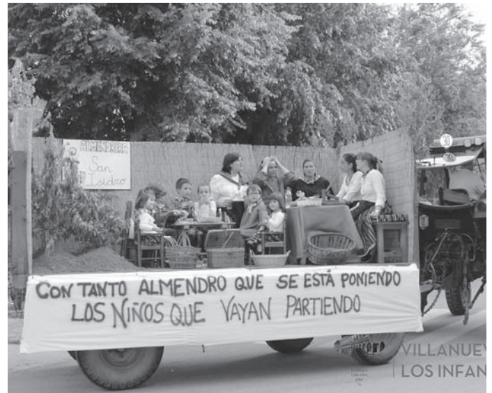
Carrozas, tercer clasificado "Con tanto almendro que se está poniendo, los niños que vayan partiendo"