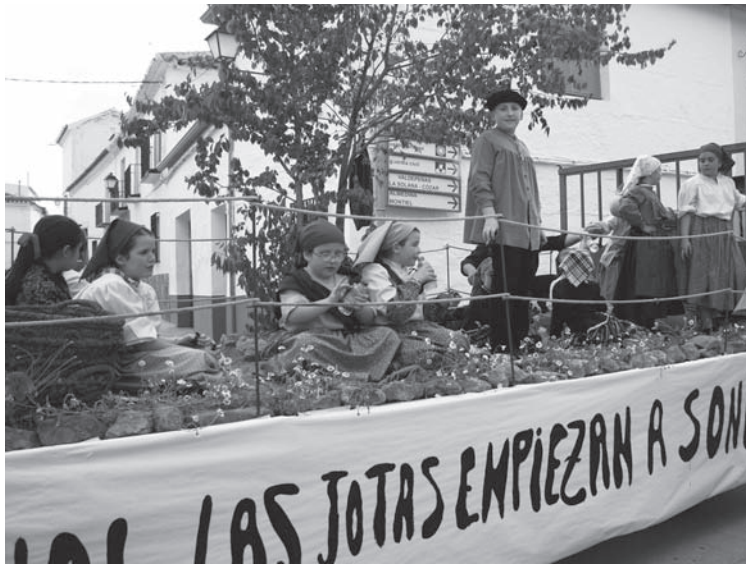
Carrozas, primer clasificado "Acabando el jornal las jotas empiezan a sonar"

Se cerró la jornada con una invitación a todos los asistentes en la Ermita del Patrono, en una tarde festiva que se alargó hasta la noche. Como siempre, la Cofradía de San Isidro de Villanueva de los Infantes agradece a todas las empresas y particulares su colaboración en los distintos actos, haciendo que la festividad del patrón de los agricultores no se pierda.