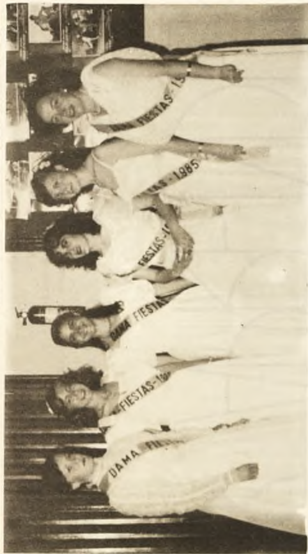
Damas de las fiestas.