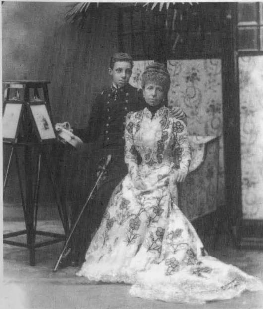
Retrato de la reina madre María Cristina de Habsburgo y del rey Alfonso XIII. Hacia 1900.

Esta Exposición se completó con la obra de fotógrafos extranjeros tan significativos como Craig Annan, A. L. Coburn, Robert Capa, Hans Namuth o Henri Cartier-Bresson, que realizaron en España algunas de sus obras más representativas.