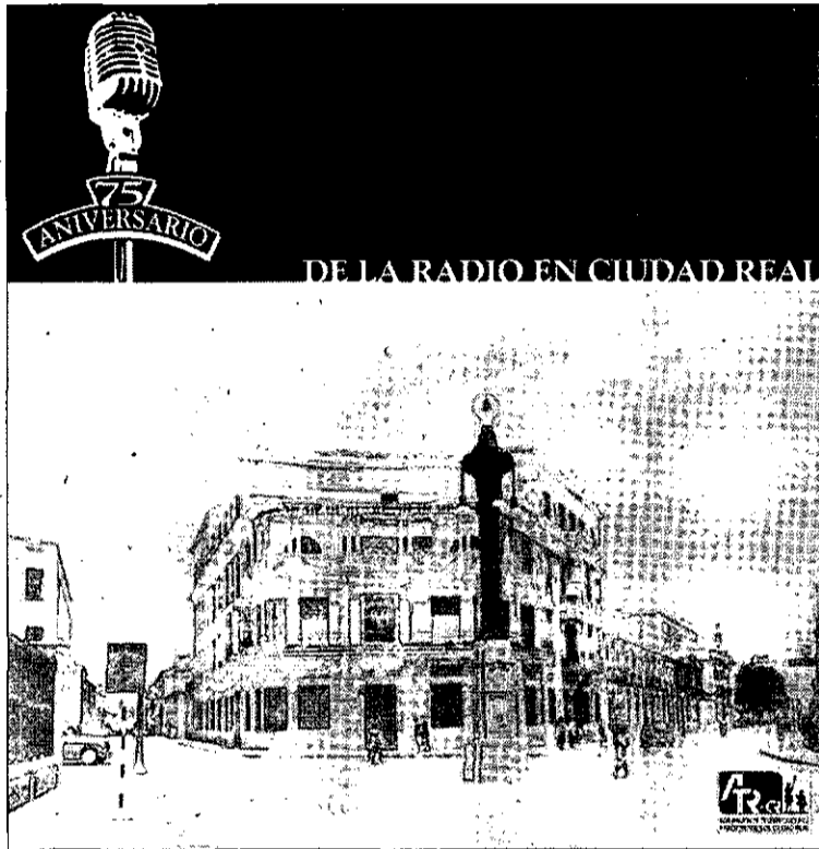
Folleto editado con motivo de la conmemoración radiofónica.