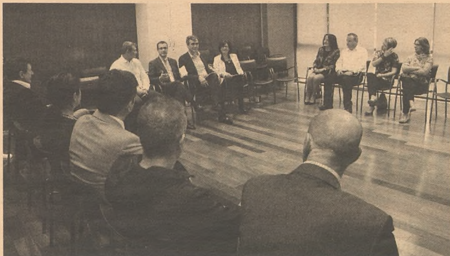
El alcalde mantuvo un encuentro con los emprendedores del centro.