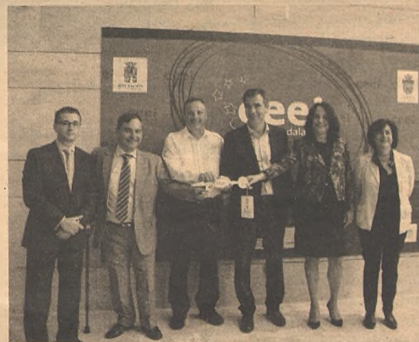
Las nuevas empresas recibieron las llaves de sus despachos.

Para aquellos que quieran más información www.ceeiguadalajara.es o en el 949-88-14-25.