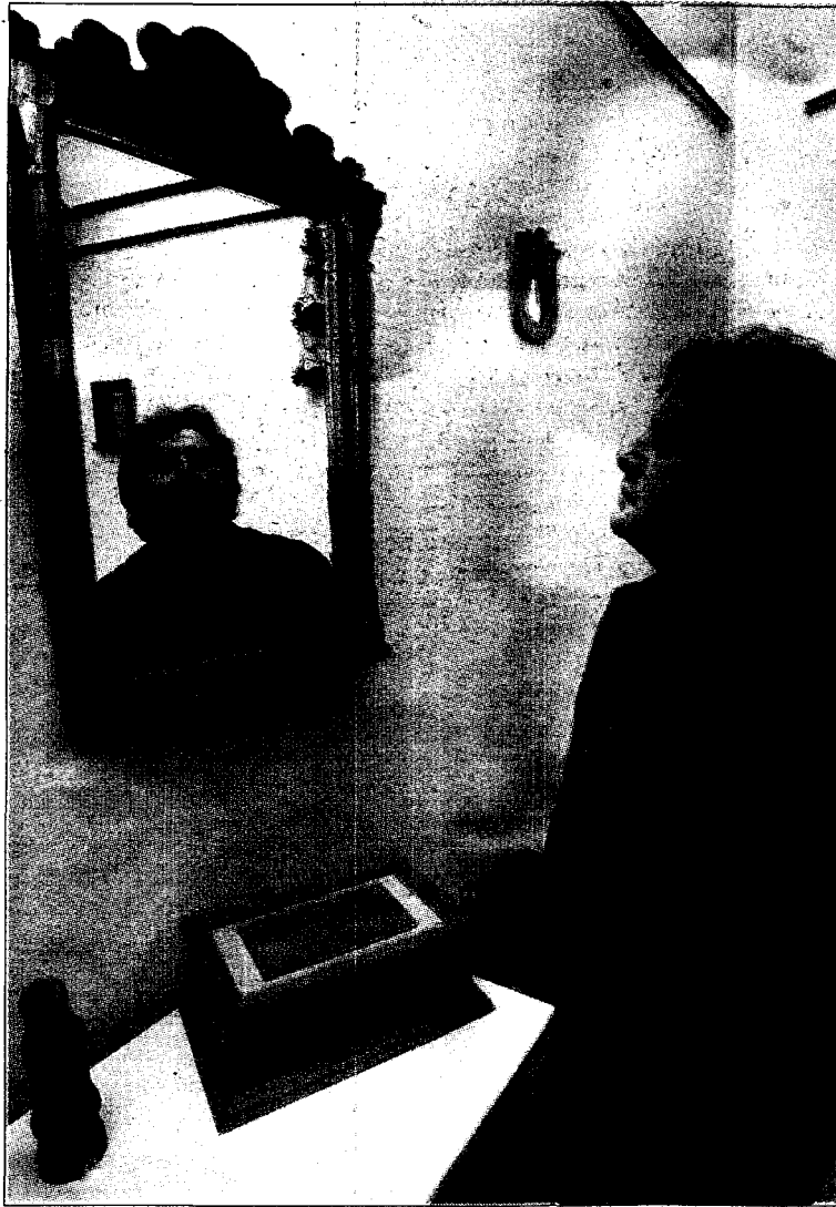
El artesano explica las características de uno de sus trabajos.

Patinetes, balancines, camiones y hasta un extraño 'automóvil', se exhiben, hasta finales de enero, en la antigua Iglesia de la Santa Cruz, «donde espero que los conquenses pasen a ver mis trabajos, junto con los del resto de artesanos que traen hasta aquí sus creaciones; tanto conquenses como de distintos lugares de la región, ya que esta es una sala que acoge todo tipo de artesanía, desde cerámica a orfebrería, pasando por el forjado de hierro, pirograbado o talla en madera». Una muestra de artesanía de la que esperan mu-