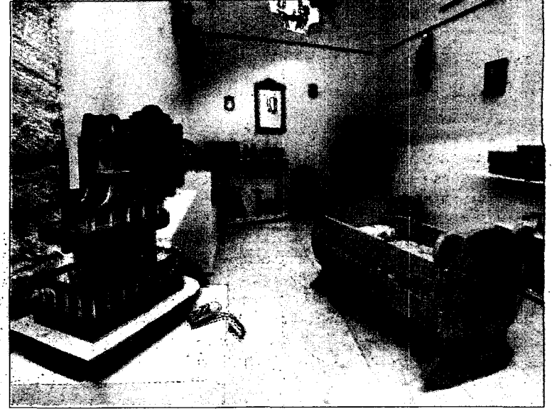
La exposición está integrada por juguetes y muebles.