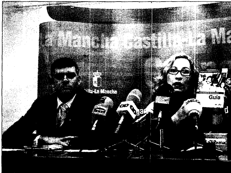
El jefe del Servicio de Consumo y la delegada de Sanidad.

Este consumismo provoca el que muchas familias se endeuden, hecho sobre el que se advierte desde los folletos de consumo, siendo el sobreendeudamiento un problema cada vez más preocupante en el ámbito de la Unión Europea. Se calcula que el gasto