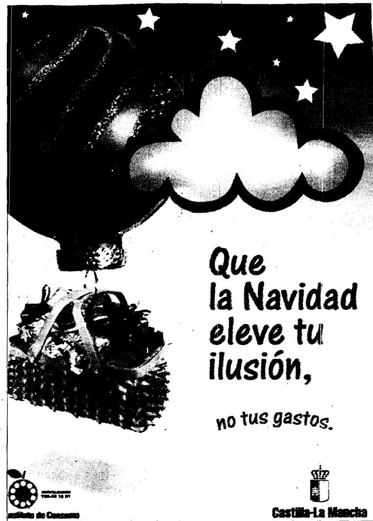
Portada del tríptico que se repartirá entre consumidores.

Respecto a los juguetes, se recomienda que contribuyan a la formación y seguridad de los niños; elegir los más adecuados a cada edad; valorar aquellos que fomentan la imaginación y la participación evitando juguetes sexistas y bélicos. La adquisición en