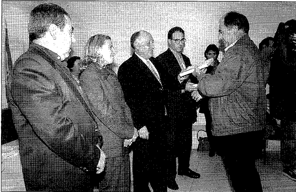
Momento de la entrega de llaves a los adjudicatarios de las nuevas viviendas.