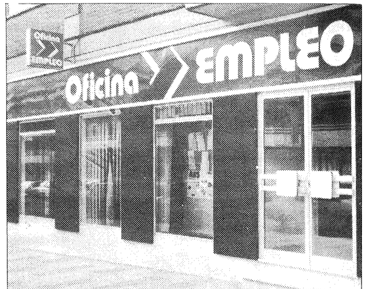
El número de personas inactivas se ha visto considerablemente reducido.

El nuevo sistema trata de cubrir una serie de necesidades entre las que se incluye una mayor demanda de información por parte de los usuarios en determinados aspectos como el mercado laboral, debido principalmente a los