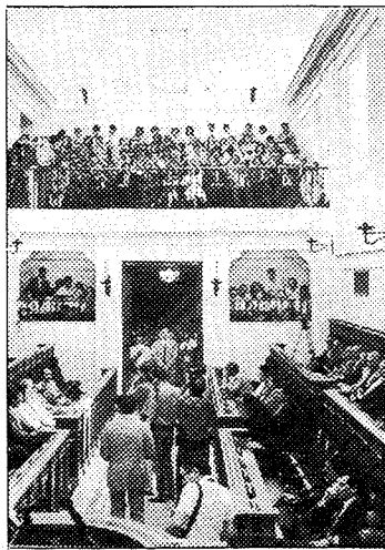
Un momento de una sesión de presupuestos

El tercero de los grupos parlamentarios presentes en las Cortes regionales de Castilla-La Mancha, el socialista, con mayoría absoluta, no ha presentado ninguna enmienda al proyecto de Ley de Presupuestos Generales de la Junta de Comunidades de la Región para 1988.