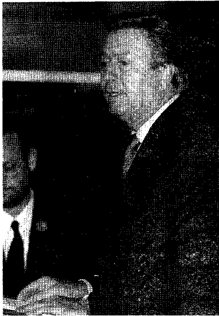
De Grandes asegura que el PSOE está sufriendo "desgarros".

• El portavoz parlamentario del PP considera un escándalo la ausencia de Zapatero en el debate más importante