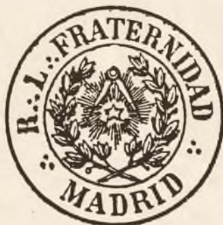
Sello de la logia de Madrid (1820)