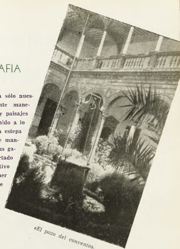
«El pozo del convento».