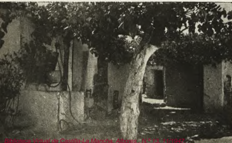
«Bajo el emparrado».