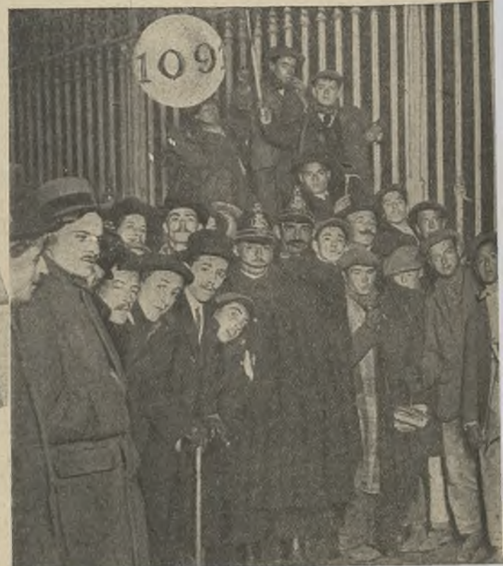
La cola de Navidad. → El señor que paga muy bien y misteriosamente el Primer puesto, un periodista extranjero, que ha estado toda la noche entre los colistas; al...