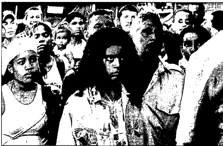
Una imagen de la película, en el centro, la niña protagonista.

Elena Romero, almagreña de quince años, se declaró encantada con el personaje de la niña protagonista, así como su vinculación con la música a través del colegio, aunque al mismo tiempo lo que más le impresionó de la cinta fue