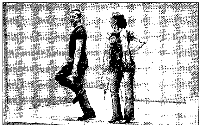
Un momento de la representación del grupo Casa de pájaros. / RUEDA VILLAVERDE

Es un planteamiento que genera situaciones divertidas y atractivas para el público, entre la nostalgia, la ironía y un tanto de reflexión.