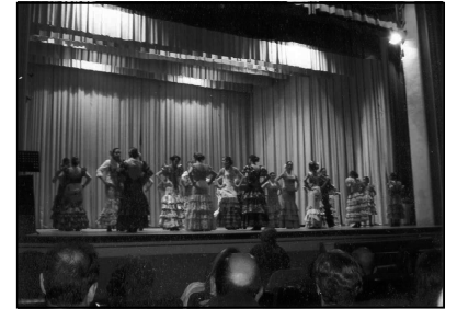
Un momento de su actuación

Sobre las 22 h. de la noche empezaba la actuación y todos se morían de nervios cuando al levantarse el telón vieron que habían llenado más de 900 butacas de 1.500 que tiene el Teatro de la Unión Musical. Y a pesar de sus nervios salieron a actuar y se metieron a todo el mundo en el bolsillo. Todo salió muy bien y algunos