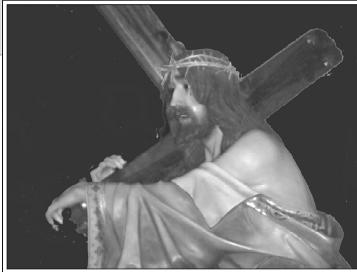
El Nazareno, Jueves Santo.