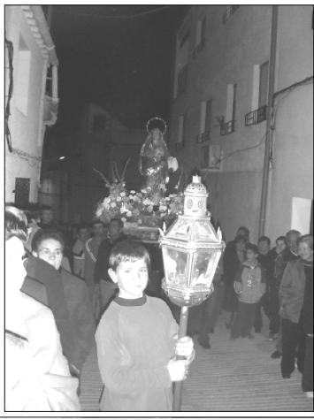
La Dolorosa, por la Calle Santa Quiteria, el Miércoles Santo.