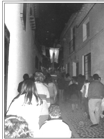
Procesión del Jueves Santo a su paso por la Calle Carnicería

Tampoco debemos quedarnos en una fe momentánea, temporal, que nos anima en estas fechas, sino trasladarla a todos los días del año, a todas nuestras experiencias de vida con los demás, manifestando así que Jesús no está muerto sino que está vivo entre nosotros.