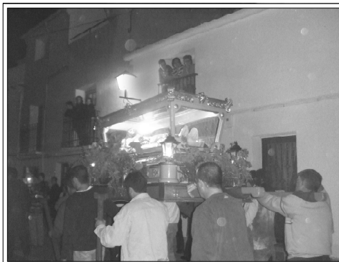
Procesión de Viernes Santo por la Calle Ancha