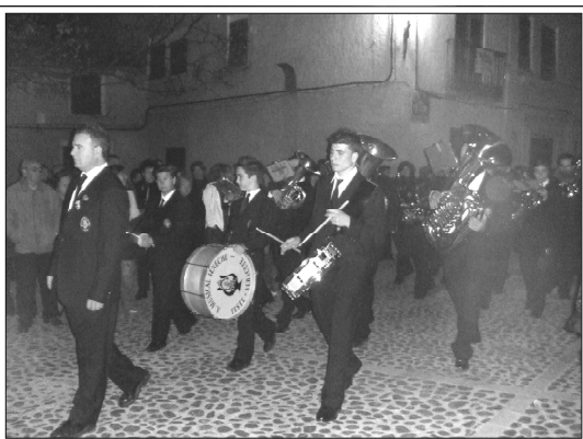
La música de la Banda reflejó tanto el dolor de la Pasión como la alegría de la Resurrección en esta Semana Santa