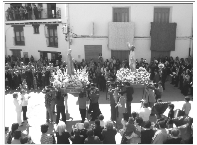
Encuentro del Resucitado con su Madre, Domingo de Resurrección.

Al paso de las Procesiones se realizan diferentes altares en algunas calles del recorrido, como este de la Calle San Marcos, la noche de Viernes Santo.