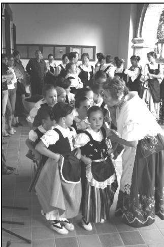
Las más pequeñas a punto de salir.