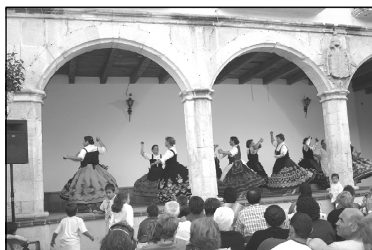
El grupo de danza de la Asociación Cultural «El Corpiño» bailando durante el Pregón