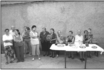
Este año, en la bajada del Santo, los vecinos de la calle de Arriba se organizaron mejor que nunca y nos obsequiaron con los primeros dulces y licores cuando la comitiva llegó al pueblo. También lo hicieron los vecinos de la calle Alta (de los que no disponemos de fotografías).