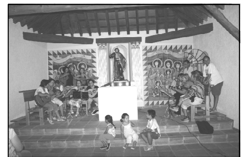
Tras la misa al aire libre, el Coro Parroquial tocó una última canción en la ermita, en honor de San Bartolomé.