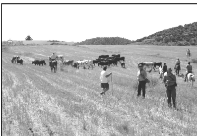
Los más madrugadores disfrutaron de las reses bravas en el campo, en el transcurso de la vereda.