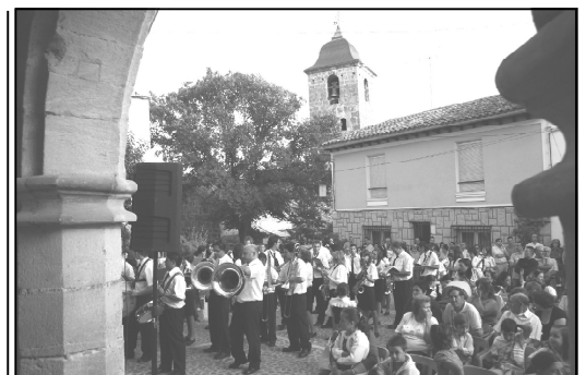
La Banda de música, presente en todos los actos de las fiestas, actuando en el Pregón.