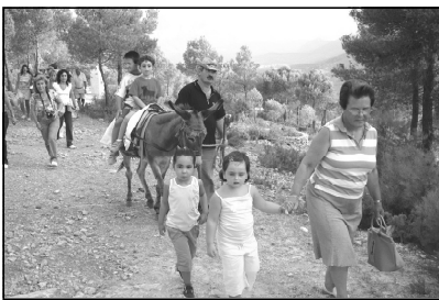
Subiendo a la Misa en la Ermita de San Bartolomé, varias generaciones disfrutaron del acto.