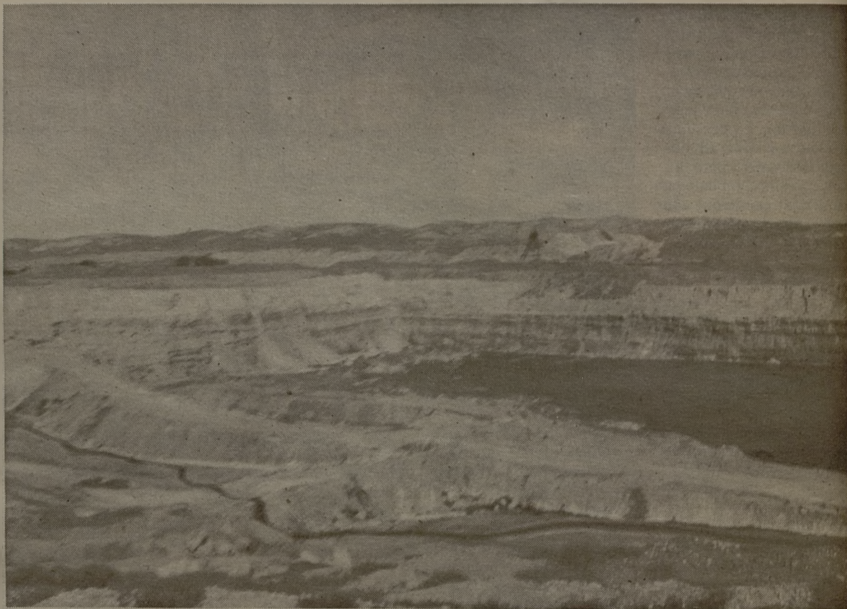
La industria de Puertollano tiene su base en las minas de carbón, algunas de las cuales continúan hoy en funcionamiento.

El carbón es un elemento fundamental para el futuro de la ciudad, pues, junto a los ingresos que suponen los yacimientos, ha permitido la instalación de la central térmica de ENECO, hasta abril de 1994 Sevillana de Electricidad, que da empleo a 146 personas y produce energía eléctrica de 220 megawatts para la Red Nacional. Asimismo, se halla en fase de construcción la central térmica de gasificación integrada en ciclo combinado ELCOGAS, la primera del