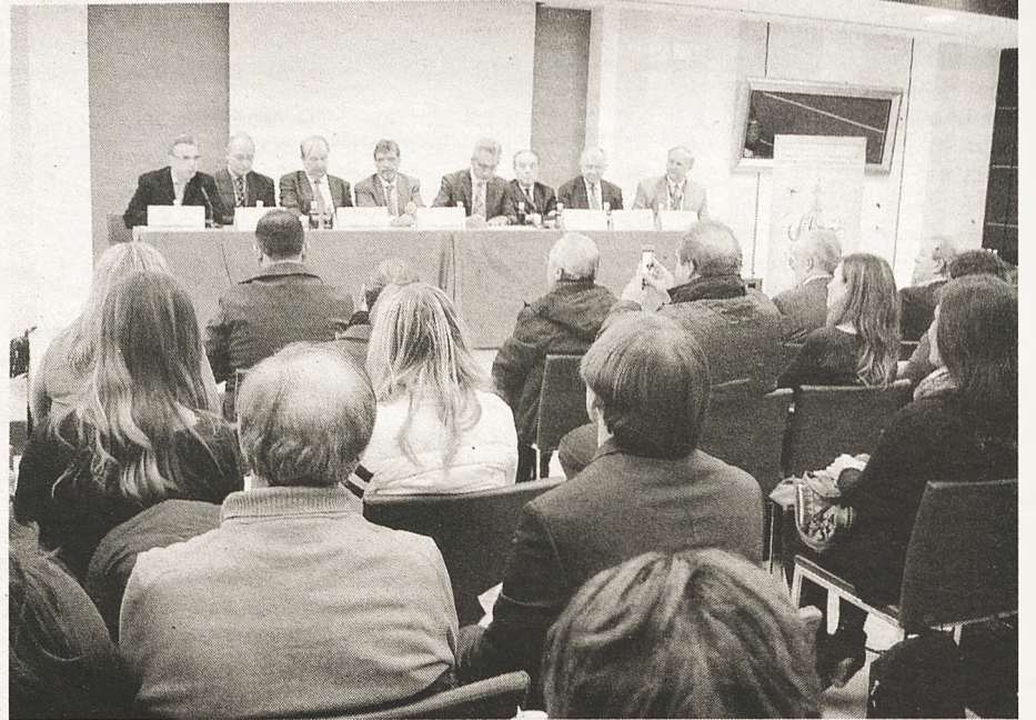
Un momento de la inauguración del congreso

En este congreso, que se celebró en el Hotel Veracruz Plaza, se realizaron doce mesas de trabajo: "Inmigración, integra-