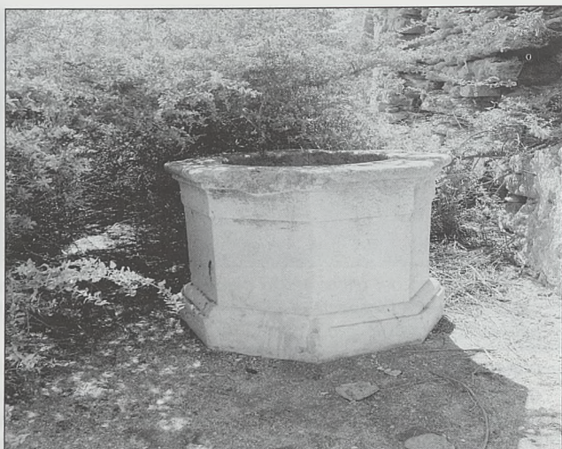
Detalle de uno de los pozos localizados en el plano de 1798

alzado) anónimos o de Matías de Juan Vergara reflejan de forma contundente lo dicho anteriormente, a lo que se añade una tímida ocupación más endeble de la zona sur del islote con baterías de madera y un cuerpo de guardia que reutiliza probablemente la chanca o algún edificio de la almadraba, posiblemente ya en desuso.