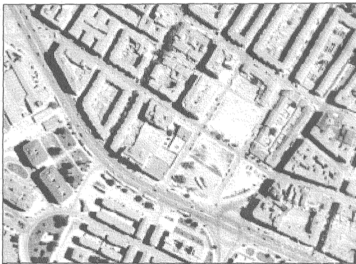
Imagen aérea de una de las zonas donde el Ayuntamiento construirá 96 viviendas de protección oficial en la zona de las antiguas cocheras de aviación, entre el Paseo de Circunvalación y la calle Rosario.

Por medio de este convenio, que el alcalde calificó como "acto de vecindad", se procederá a la construcción de 96 viviendas de protección oficial, en régimen general, en la zona de las antiguas cocheras de aviación, en la esquina entre el Paseo de Circunvalación y la calle Rosario. Además, se creará una amplia zona verde en la confluencia de las calles Bernabé Cantos, Blasco de Garay y Lepanto, habiéndose fijado también una dotación de 3.587 metros cuadrados para instalaciones de-