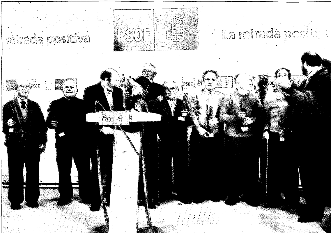
El ministro Rubalcaba con los homenajeados, Lamata y Martínez Guijarro.