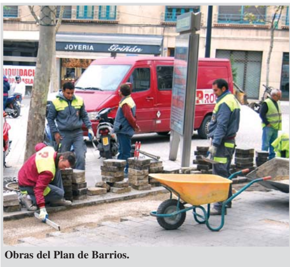
Obras del Plan de Barrios.