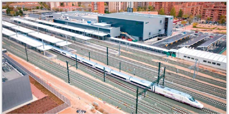
Llegada del Ave a la estación de Albacete Los LLanos.