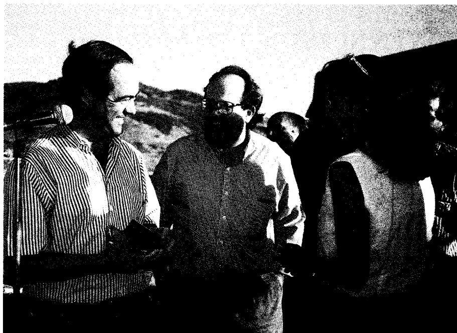
El Presidente, junto al Rector, recibe una medalla conmemorativa de mano de los alumnos.

Además somos un exponente importante porque no pensamos que una Universidad se prestigie por su coste, por su dureza o por su bajo índice de aprobados, es el conjunto de su alumnado el que le da y le quita prestigio. Así pues a nosotros nos corresponde ser la tarjeta de presentación de esta Facultad y de esta Universidad, y no nos da miedo, asumimos el reto porque nos negamos a ser