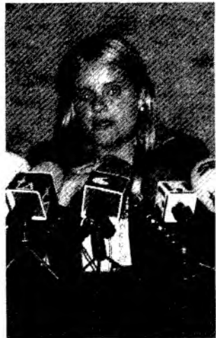
María del Mar Blanco.

María del Mar Blanco finalizó en Manzanares su visita a diferentes municipios de la provincia de Ciudad Real, donde participó en diversos actos de precampaña con motivo de las elecciones al Parlamento Europeo. La diputada regional del PP en el País Vasco se refirió, ante los medios de comunicación, a la nueva etapa que se ha iniciado en el País Vasco con el cambio de gobierno.