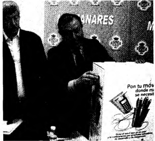
Contenedor de recogida de móviles.