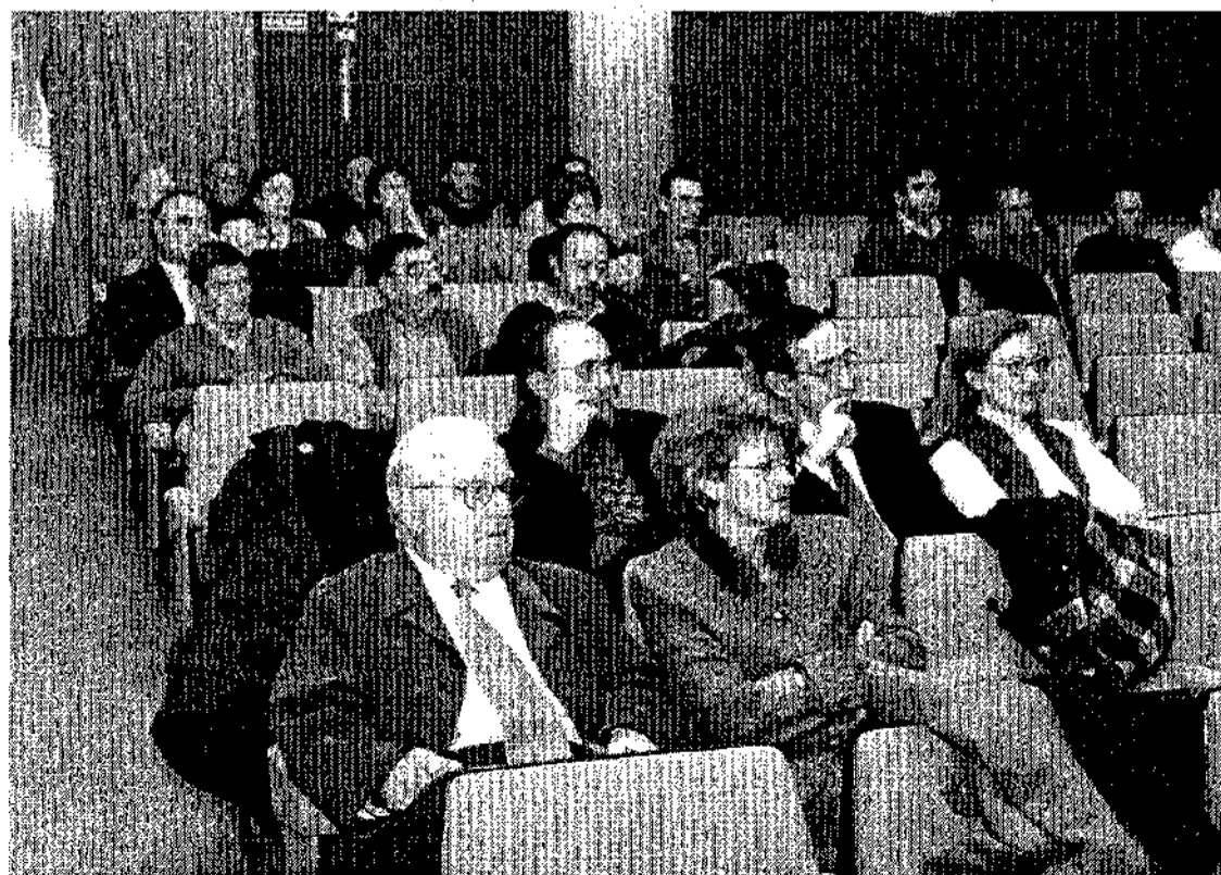
Público asistente al discurso de investidura del académico.