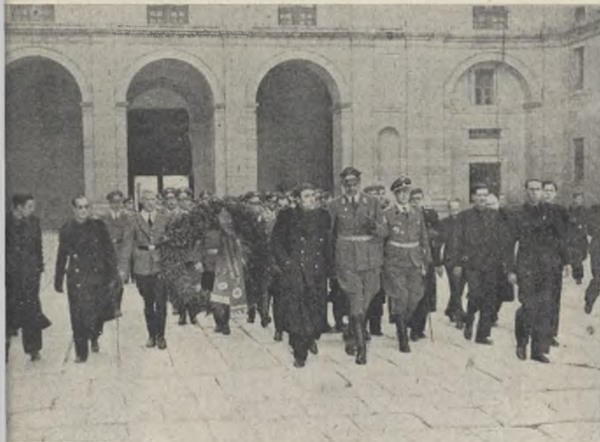
Representantes del Reich depositaron una gran corona de flores en la tumba del Fundador de Falange.

—Entre los no existentes figura un drama bíblico titulado Moisés , escrito en verso durante su odisea carcelaria. Y el original de un ensayo sobre Arabes, celtas y bereberes , cuya copia guardo, y que no se publicará, cumpliendo deseos expresos suyos de no dar a la luz los trabajos literarios. En este mismo caso se halla su novela El navegante solitario .