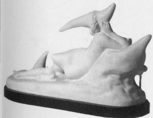
SALVADOR DALÍ. Nu féminin, hystérique et aérodynamique.

Pues bien, ¿qué significa eso del pequeño formato? En principio, el tamaño de una obra de arte no puede asociarse con ningún momento histórico específico, ni estilo. En realidad, ocurre algo parecido con los materiales con