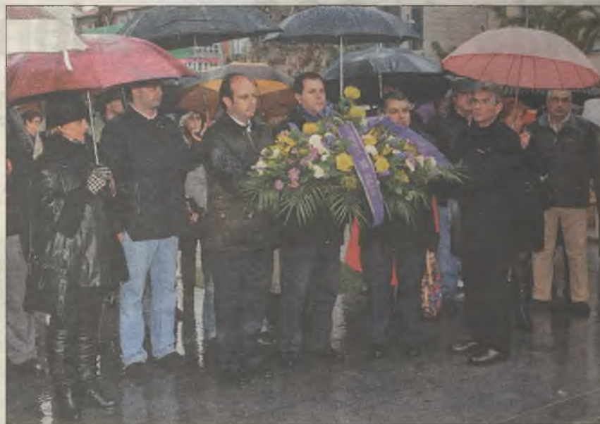
El acto en memoria de las víctimas se celebra el domingo a las 13.00 horas