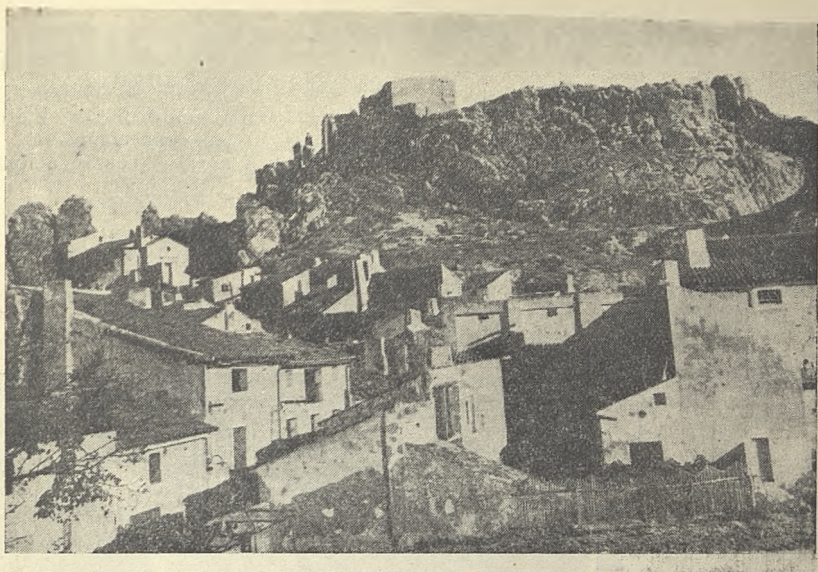
Ayora Barrio del castillo coronado por los carcomidos muros de la fortaleza.