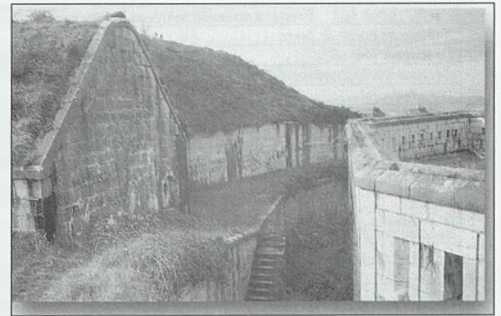
Ilustración nº 19 Izda. Batería. Centro: foso interior; Dcha. Cuartel

encontraba también la escalera doble (36) de acceso al foso interior y hacia el frente la pequeña rampa de acceso a la batería del NE.