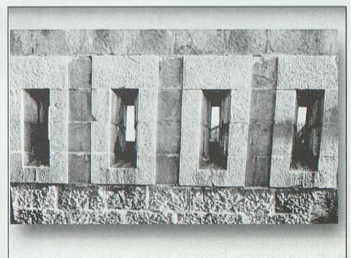
Ilustración nº 21 Aspilleras de la azotea, vistas desde el exterior