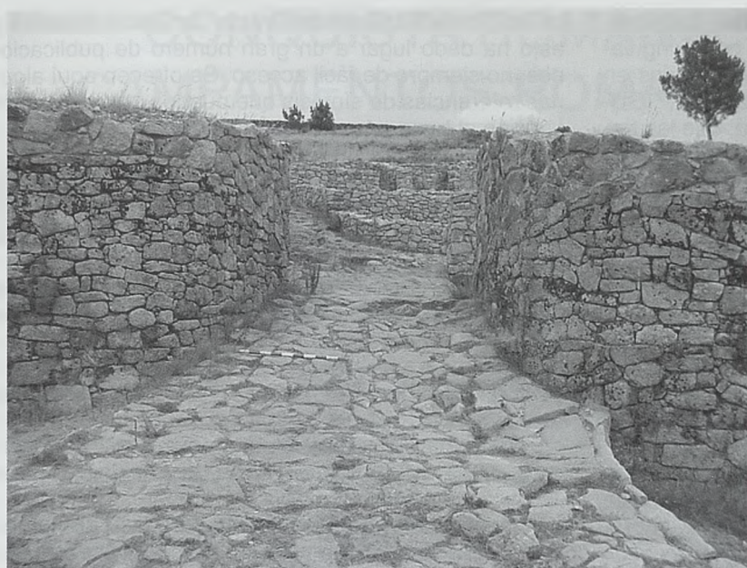
Figura 18. Entrada al oppidum de Lansbrica, Ourense

ña en forma de pasillo, que posee la singularidad de estar flaqueada por un gran torreón. Pese a este elemento, no se trata de un vano particularmente monumental, como no lo son los de la mayoría de oppida: normalmente documentamos meras interrupciones en la muralla. La entrada de Santa Trega es en escalera, un rasgo que identifica a muchos castros de la Segunda Edad del Hierro, como Castrolandín (Pontevedra) y Baroña (A Coruña). Pese a que las entradas de los