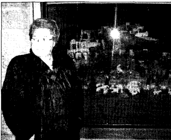
La pregonera, junto a un belén.