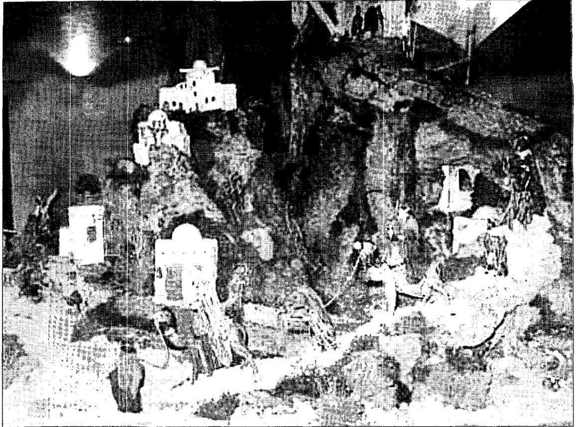
Belén monumental instalado en la Casa Parada.