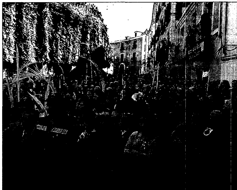
Las actividades las organiza la Hermandad de Jesús entrando en Jerusalén./L.T.

«Este es uno de los principales objetivos que nos hemos marcado, porque, en definitiva, los niños y jóvenes son el presente y el futuro de nuestra tradición», apunta la propia Hermandad en un comunicado de prensa.