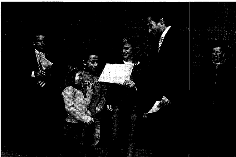
Unos de los premiados recogen el premio de manos del alcalde.