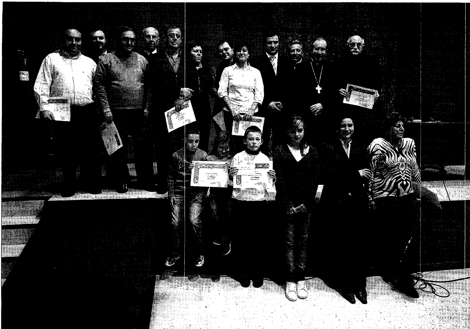
Los presentes en el acto posaron juntos a su término.

Una vez finalizada la entrega de premios, los presentes posaron en 'foto de familia' para los medios de comunicación.