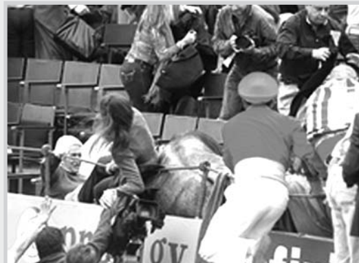
El toro saltó al tendido nada más salir del toril.

✓ Pajarito es el nombre del toro que consiguió saltar al tendido de la plaza México, en el transcurso de la corrida de toros en la que Pablo Hermoso de Mendoza consiguió cortar el rabo que hace el número 120 de los que se han paseado en el Embudo de Insurgentes. El toro, cárdeno, consiguió apoyarse en los tejadillos que cubren algunos de los burladeros del callejón. Por fortuna, el toro quedó atrapado en el entramado de asientos metálicos fijos de las primeras filas y pudo ser descabellado por los profesionales, entre ellos, Hermoso de Mendoza. Antes provocó lesiones y una herida de 10 centímetros en la pelvis a una mujer de 60 años.