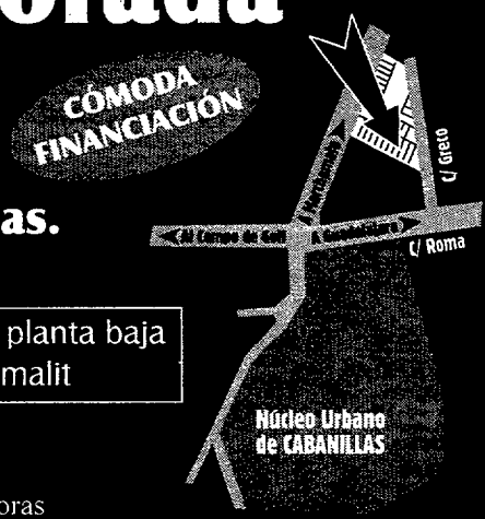
Núcleo Urbano de CABANILLAS