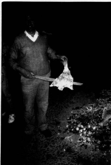
"Comidas de fuego". Pollo para un arroz y bacalao para el "Somallao".