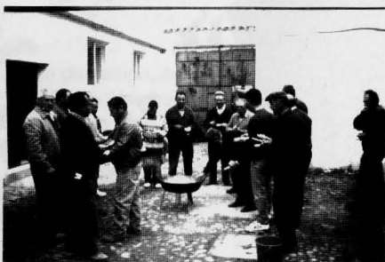
"Cucharada y paso atrás". Hermanos de la Hermandad de San Antón celebrando una comida antes de la rifa.