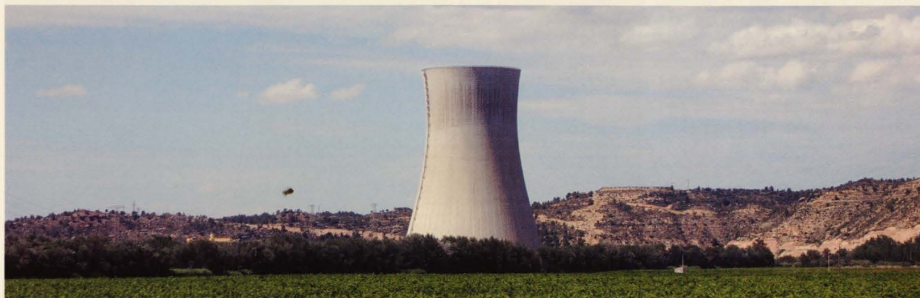
El cierre de centrales nucleares afecta desfavorablemente a la calidad y disposición de la energía a precios razonables.

Por último, las Cámaras de Comercio han asegurado que España necesita un modelo energético que garantice el suministro a precios y calidades competitivas y que reduzca nuestra alta dependencia exterior y las emisiones de CO 2 , para poder cumplir con los compromisos de Kioto.