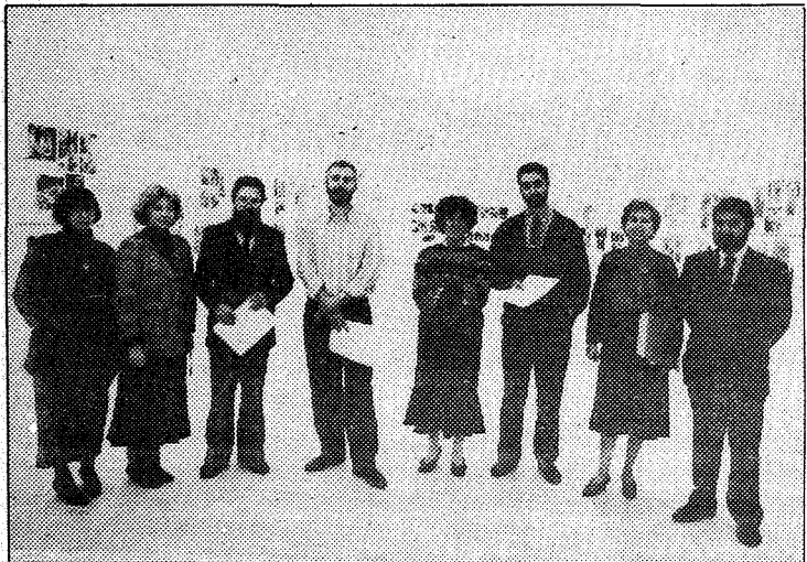
El jurado en pleno, después de la entrega de premios

En el capítulo de color, «Onín» consiguió el primer lugar con idéntico premio en metálico que el que consiguiera el primer clasificado en blanco y negro. En segundo lugar, «Navateros», seguido por tres menciones especiales a los trabajos «Minifundios: remiendos del paisaje», «Los niños ofrecidos de Santa María de Ribarteme» y «Tipos y trajes de Salamanca». Por último la foto «el traje ansoleño» recibió el premio al cartel con 100.000 pesetas.