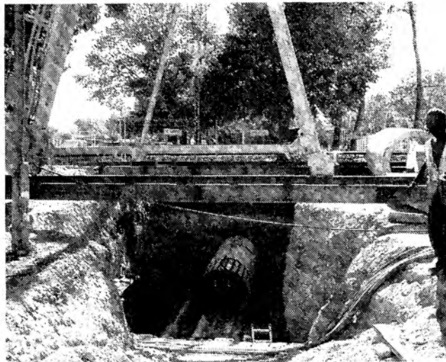
Detalle de los trabajos de la tuneladora.

Mientras que la máquina va abriendo el túnel, inserta la tubería, de 1,20 metros de