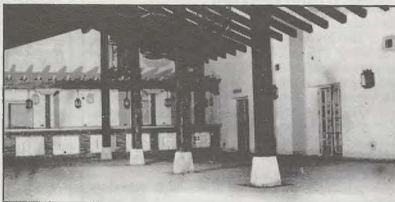
Vista parcial del salón y bar del hotel municipal.